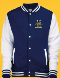
Teddy HCC 60€