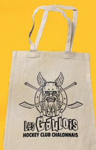
Tote bag HCC 6€