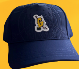
Casquette HCC 19€